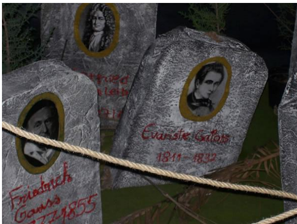
Imagen 5: Varias tumbas del Cementerio Matemático

En cada tumba se puede leer el nombre y las fechas de nacimiento y fallecimiento de un matemático, y por otro lado, en la placa respectiva un epitafio sobre el personaje que está escrito en inglés y francés.