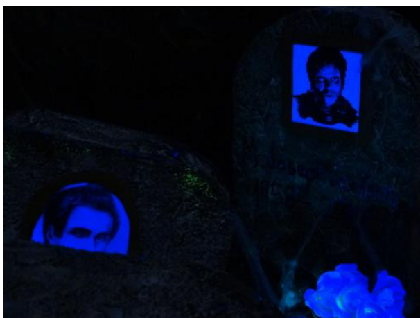
Imagen 20: "Intruso" en el Cementerio Matemático durante la IX Semana Temática