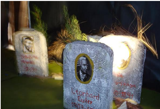
Imagen 16: Algunas lápidas durante la VII Semana Temática

En las ediciones octava, novena y décima de la Semana Temática, el Cementerio Matemático ha seguido siendo una de las actividades más relevantes y emocionantes. Durante estas ediciones se ha ampliado el número de tumbas con nuevos matemáticos y varios científicos con la intención de seguir utilizando el Cementerio como recurso didáctico.