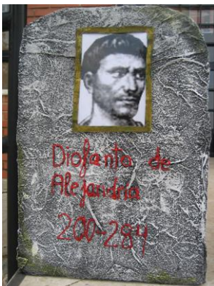
Imagen 4: Tumba realizada en el Cementerio Matemático sobre Diofanto de Alejandria

resolver la ecuación: \frac{1}{6}x + \frac{1}{12}x + \frac{1}{7}x + 5 + \frac{1}{2}x + 4 = x )