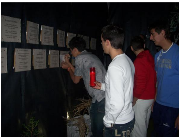
Imagen 10: Alumnos visitando el Cementerio Matemático

Una vez entramos en el Cementerio Matemático, y después de verlo en su conjunto, se debe ir rellenando el cuestionario.