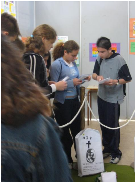
Imagen 14: Alumnos visitando el Cementerio Matemático durante la V Semana Temática

Durante estos años se han ido compaginando el montaje en el centro como actividad en Halloween y durante las Semanas Temáticas.