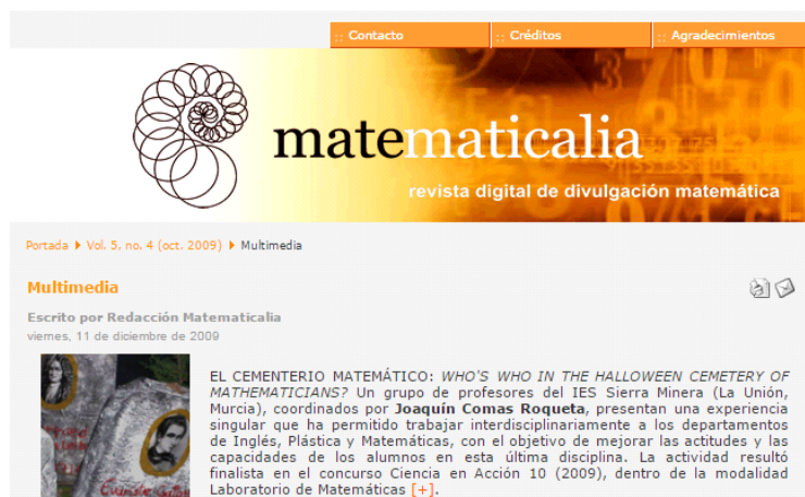
Imagen 25: Artículo sobre el Cementerio Matemático en la revista digital Matematicalia

También se realizaron reportajes sobre nuestra actividad en las revistas Matemática, Adiós y Magisterio.