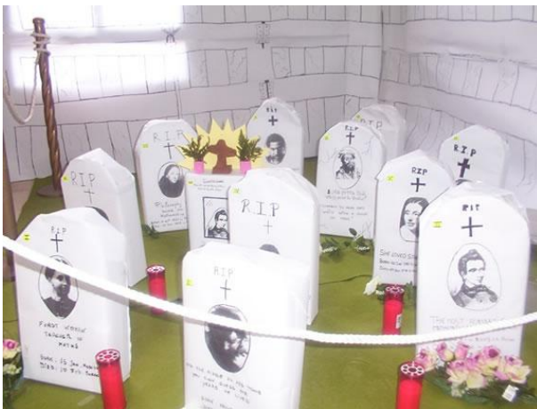
Imagen 12: Cementerio Matemático en el vestíbulo del centro