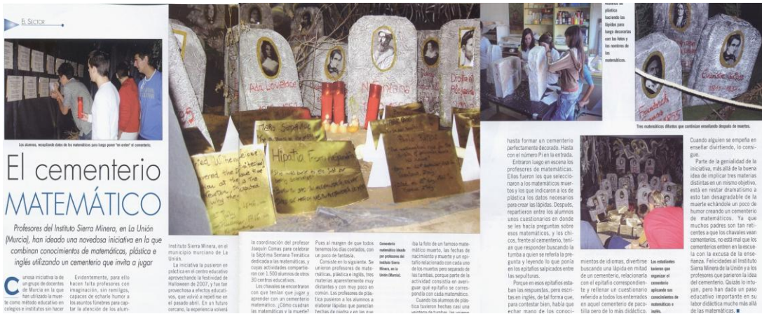
Imagen 26: Artículo sobre el Cementerio Matemático en la revista Adiós