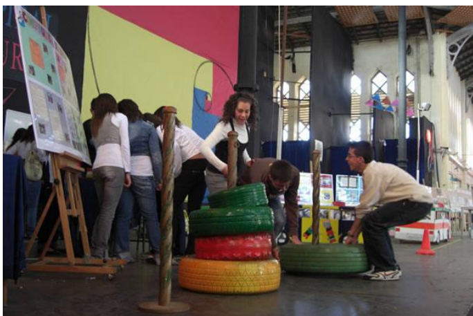
Imagen 1: Actividad durante las Semanas Matemáticas

Las aulas están dirigidas por los alumnos que han creado las actividades. Este evento se realiza durante varios días, agrupando a los alumnos por niveles educativos e invitando a participar a otros centros.