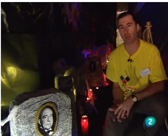
Imagen 30: Fotograma del vídeo emitido por TVE