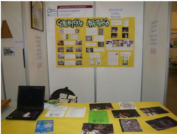
Imagen 29: Stand donde presentamos la actividad