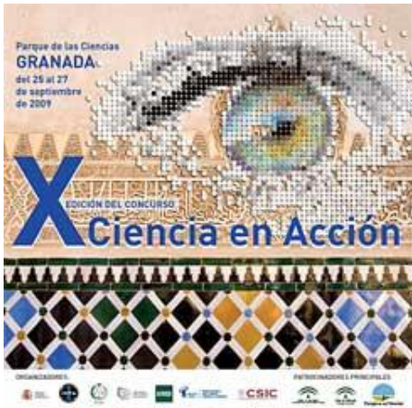
Imagen 28: Cartel de la X edición de Ciencia en Acción