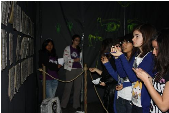
Imagen 18: Alumnos visitando el Cementerio Matemático durante la VIII Semana Temática