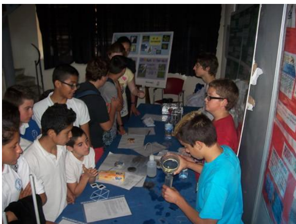
Imagen 2: Actividad durante las Semanas Matemáticas