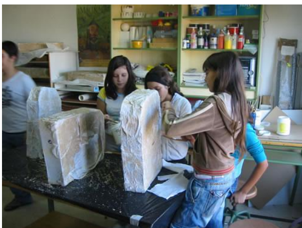
Imagen 8: Alumnas elaborando las tumbas