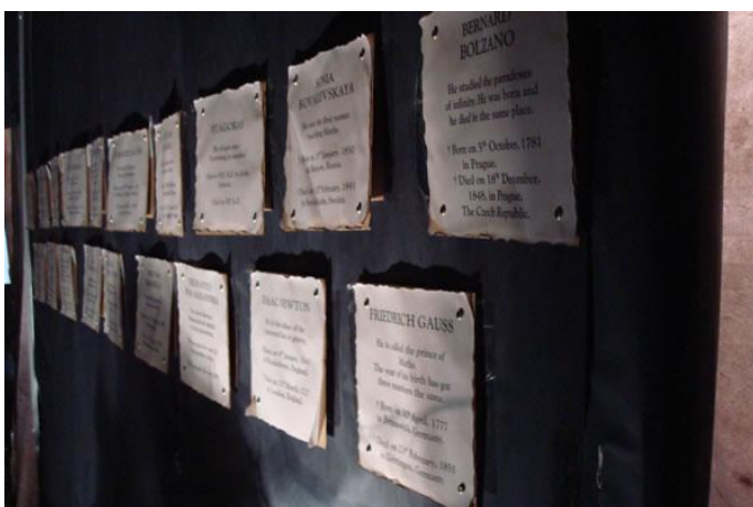
Imagen 6: Placas con los epitafios en inglés y francés.