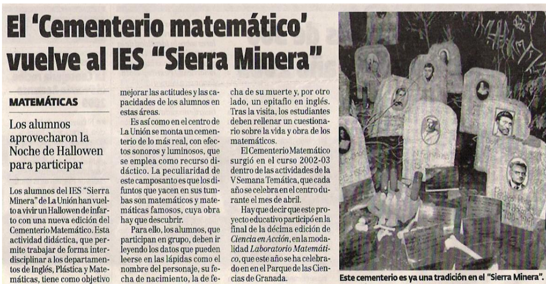
Imagen 27: Artículo sobre el Cementerio Matemático en la revista "Magisterio

Como ya hemos comentado anteriormente, el Cementerio Matemático fue finalista en la décima edición de Ciencia en Acción, en la modalidad "Laboratorio Matemático". Durante la edición montamos el Cementerio Matemático para que todos los asistentes pudieran visitarlo, y Televisión española, dentro del especial sobre la X edición de Ciencia en Acción, presentó nuestra actividad.