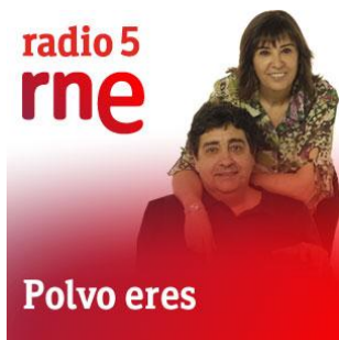
Imagen 24: Imagen promocional de Polvo eres.