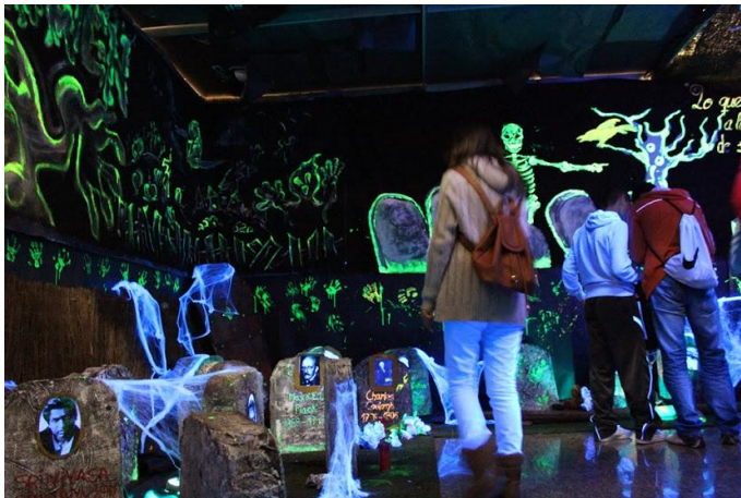
Imagen 22: Alumnos visitando el Cementerio Matemático durante la X Semana Temática

La actividad también ha sido el germen de la exposición “El Top 100 de los matemáticos” en la que nuestros alumnos han realizado trabajos sobre cien de los más importantes matemáticos de la Historia ( http://dematesna.es/index.php?option=com_content&view=article&id=281:el-top-100-de-los-matematicos&catid=75:expos&Itemid=190 )