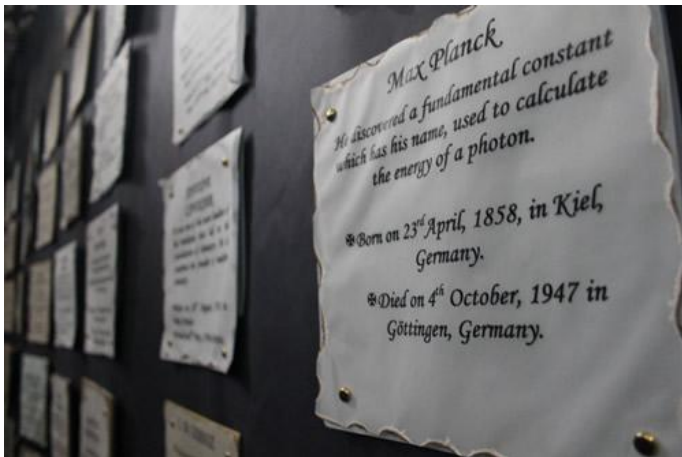
Imagen 21: Decoración del Cementerio Matemático durante la IX Semana Temática