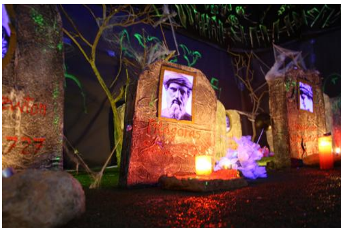
Imagen 19: Decoración del Cementerio Matemático durante la VIII Semana Temática