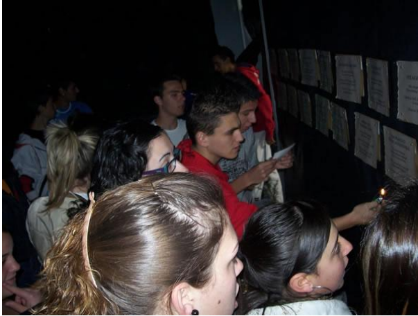
Imagen 15: Alumnos visitando el Cementerio Matemático durante la VII Semana Temática