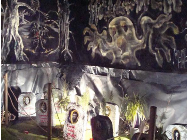
Imagen 11: Decorado del Cementerio Matemático

La actividad lo largo de las distintas ediciones