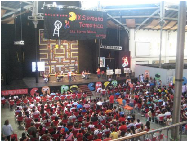
Imagen 3: Actividad durante las Semanas Matemáticas