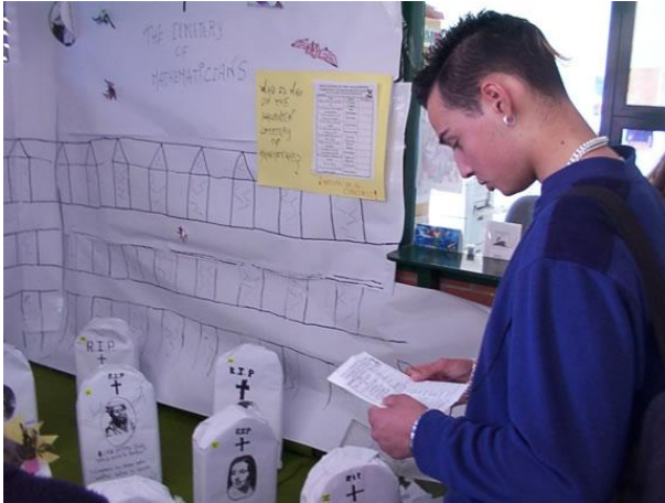
Imagen 13: Alumno visitando el Cementerio Matemático en el centro