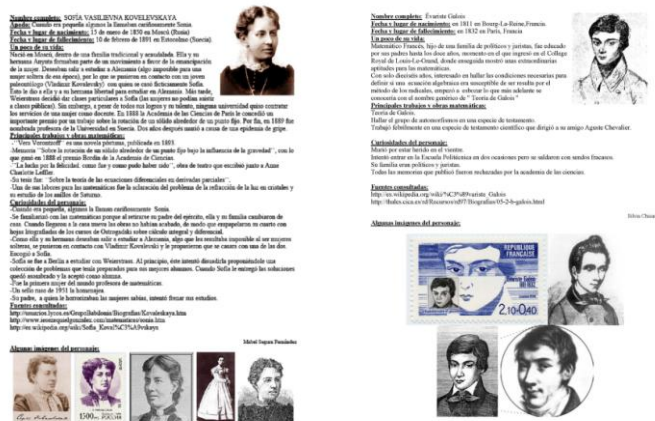
Imagen 23: Ejemplos de trabajos realizados por los alumnos