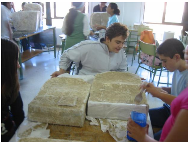
Imagen 7: Alumnos elaborando las tumbas

Simultáneamente se construyeron las tumbas con diversas técnicas plásticas. Las lápidas se crearon con cartón, posteriormente con cola y agua se pegó papel y se creó una textura aplicando arena. Se pintaron aplicando capas para simular la piedra y finalmente se pusieron los datos y las fotos de los matemáticos.